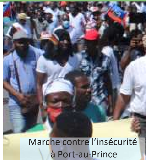
Marche contre l'insécurité à Port-au-Prince

De façon indiscriminée, les gangs armés ouvrent le feu sur les bus des transports en commun qui s'aventurent sur la route, et ce, depuis le début de la guerre entre les groupes armés. Les familles ont peur d'envoyer leurs enfants à l'école.