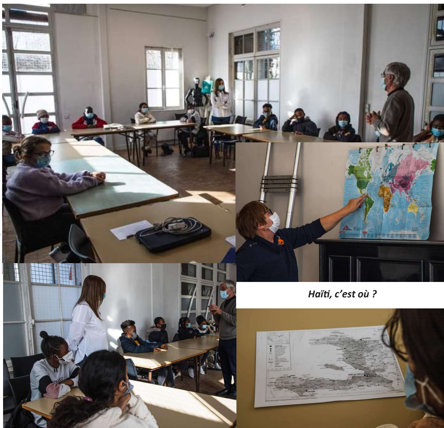
Haïti, c'est où ?

Nous remercions la mairie d'Épinay-sous-Sénart, qui nous soutient depuis le début.