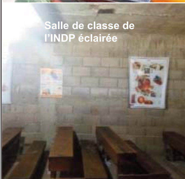
Salle de classe de l'INDP éclairée