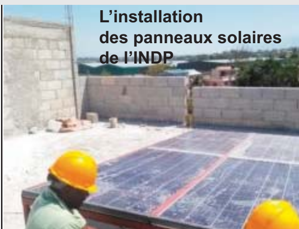
L'installation des panneaux solaires de l'INDP

Nous faisons beaucoup avec peu de moyens.